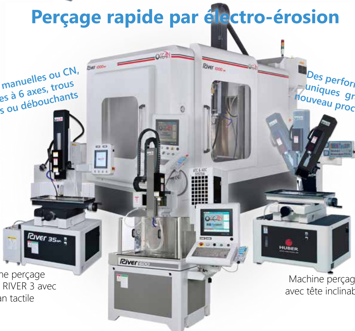
Machine perçage manuelle RIVER 3 avec écran tactile

Des performances uniques grâce au nouveau processeur !